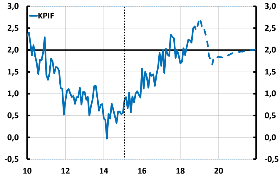
Inflationen nära målet