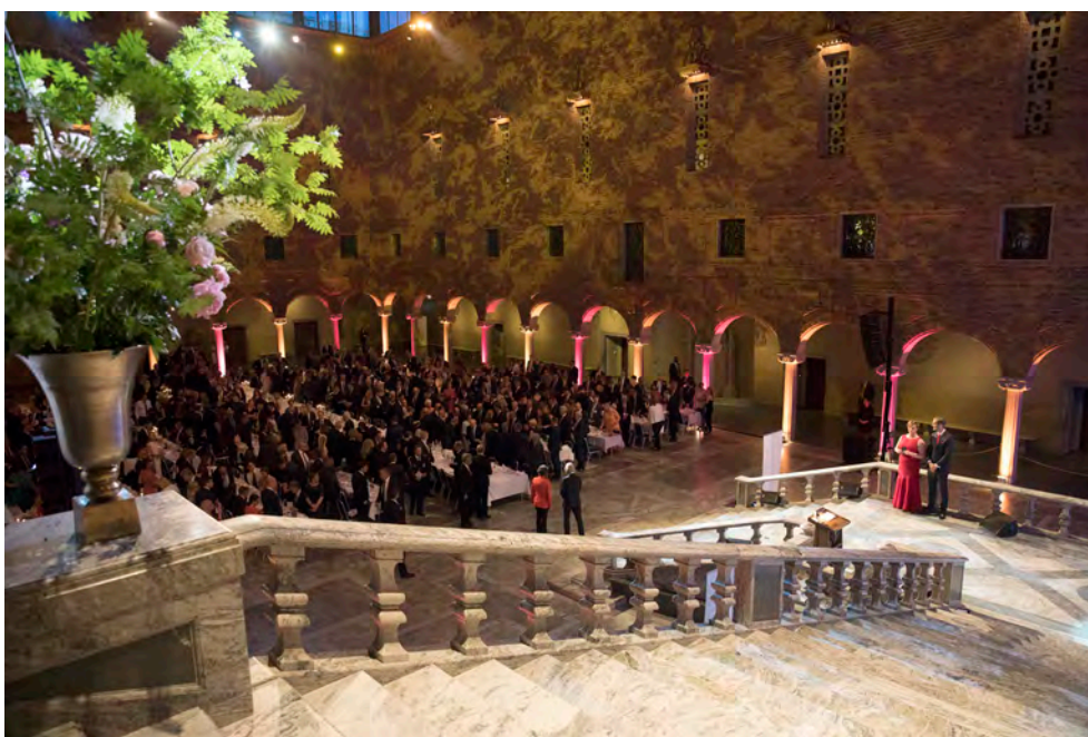
Blå hallen under jubileumsmiddagen.

För Riksbankens medarbetare hölls avslutningsvis en vickning i riksbankshuset.