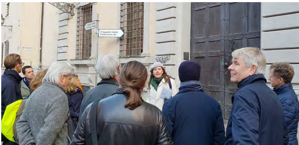
Stadsvandring på temat "Pengarna och makten".

Riksbanken bokade dessutom ett par vandringar för särskilda sällskap, till exempel för Riksbankens kulturförening.