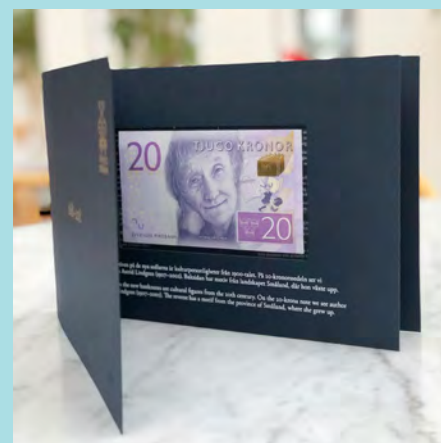
Sedelfolder med en 20-kronorssedel.

Vid det öppna huset användes också: En pyramid av kopior av guld tackor Chokladaskar i form av guld tackor Montrar med information om Riksbanken