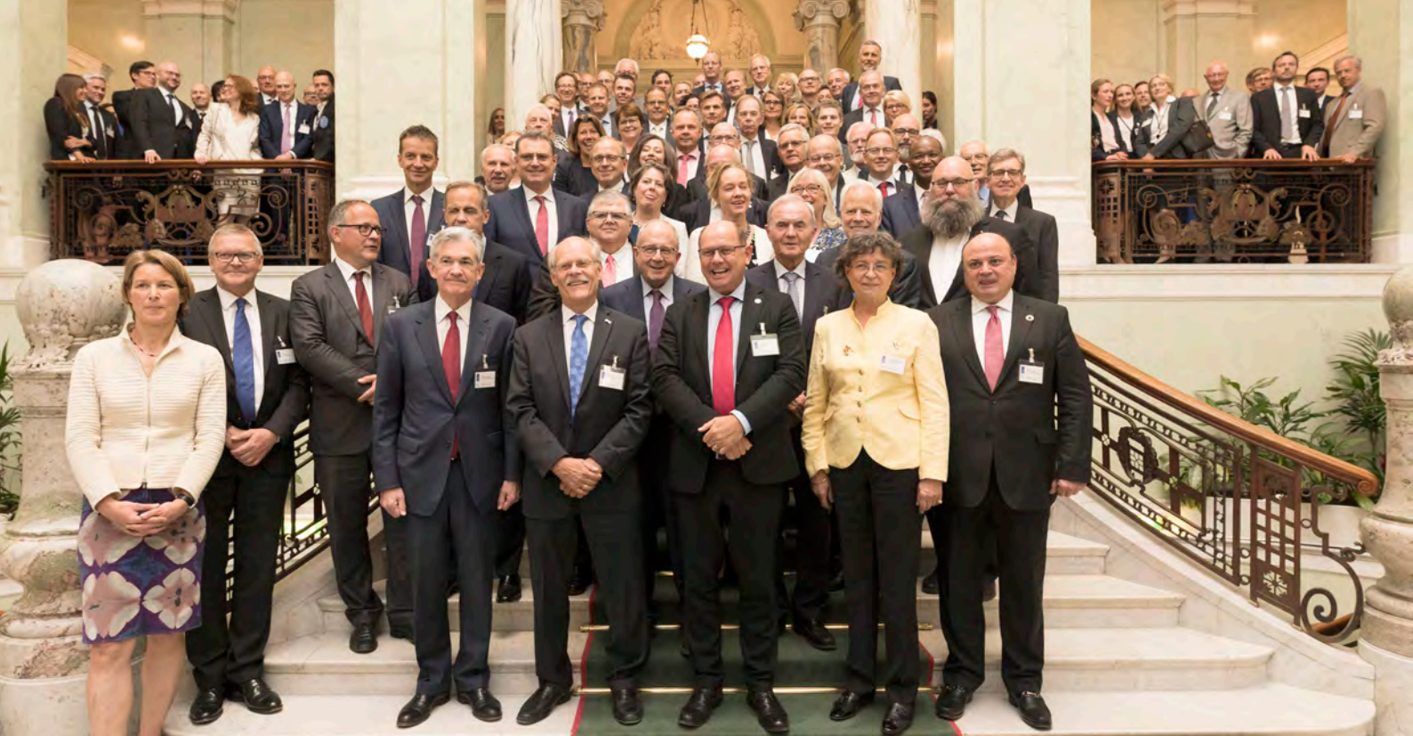
Deltagare vid jubileumskonferensen.

konferensdeltagare hade Riksbanken blockbokat rum på Grand Hôtel Stockholm, Hotell Kungsträdgården och DownTown Camper. Gästerna kunde då själva boka dessa rum till "riksbankspriser".