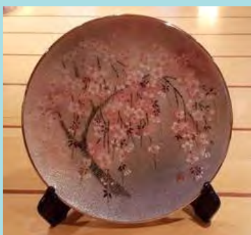
Emaljfat från Bank of Japan.

Riksbanken fick under jubileumsåret motta gåvor från Bank of Japan, Banque de France, Bank of Israel, Palestinian Monetary Authority, Eesti Pank samt Crane Currency. Dessa finns närmare beskrivna i dokumentet Förteckning över gåvor till Riksbanken 350 år som återfinns i arkivet med diarienummer 2018-01059.