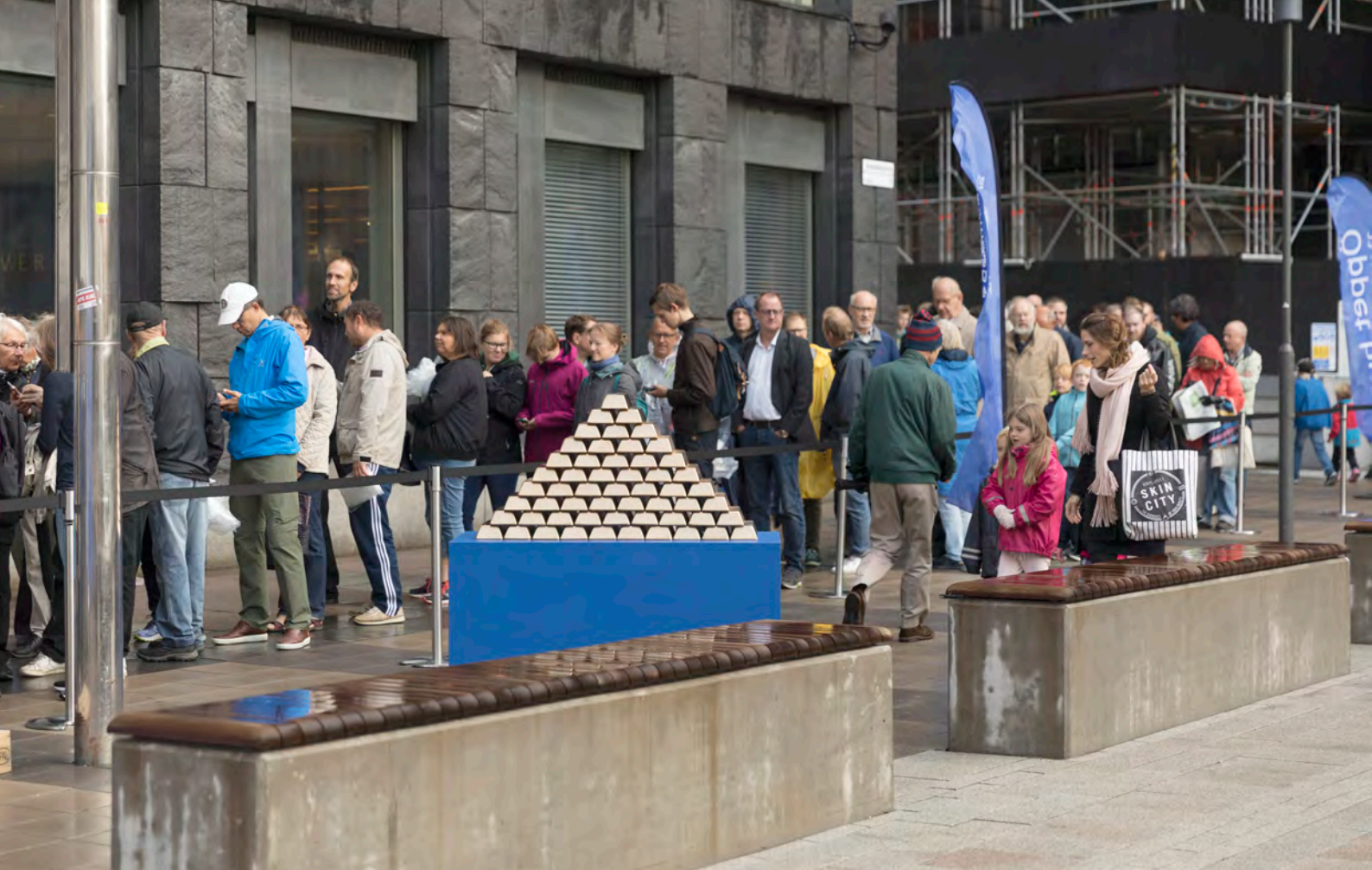
En del av kön till Riksbankens öppna hus den 22 september.