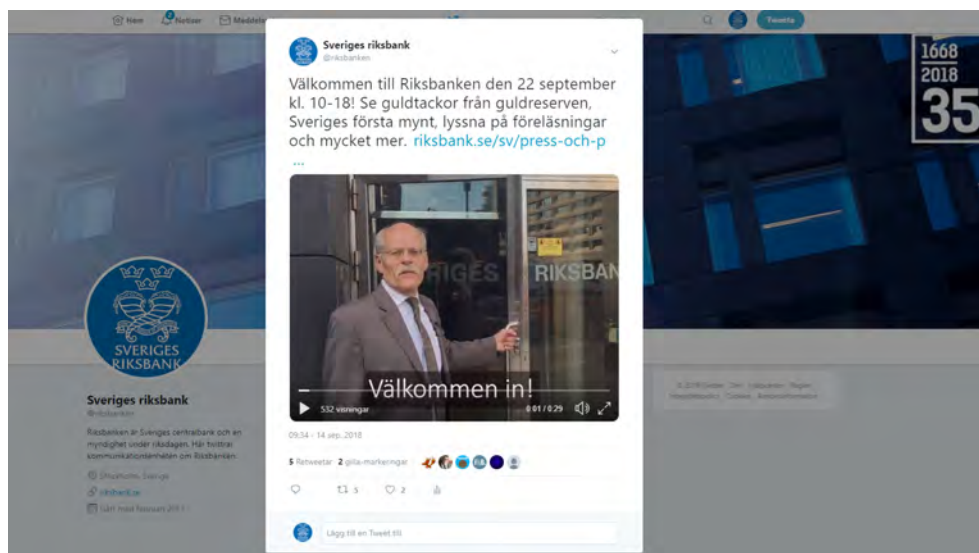
Från Riksbankens Twitter.

Under jubileumsdagen publicerades en mängd inlägg på framförallt Facebook, men även Twitter och LinkedIn.