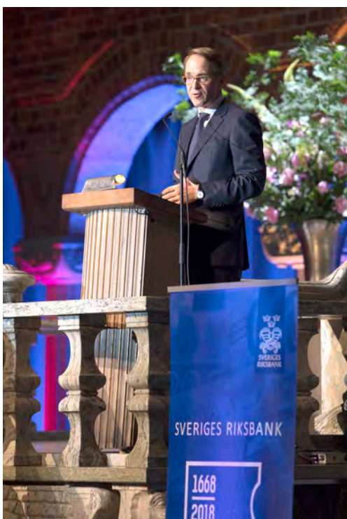
Jens Weidmann, chef för Deutsche Bundesbank.

utifrån det körschema som projektledningen i samarbete med underhållarna, konferenciererna och kökschefen tidigare hade tagit fram.