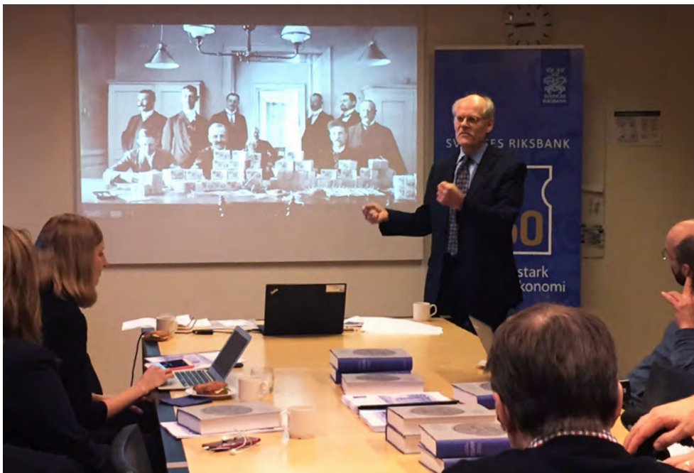
Pressfrukost den 25 januari 2018.

I december 2017 hölls ett frukostmöte för riksbanksmedarbetarna, som en kick off för personalen inför jubileumsåret. Där berättade Stefan Ingves kort om Riksbankens historia och vilka aktiviteter som väntade under jubileumsåret.