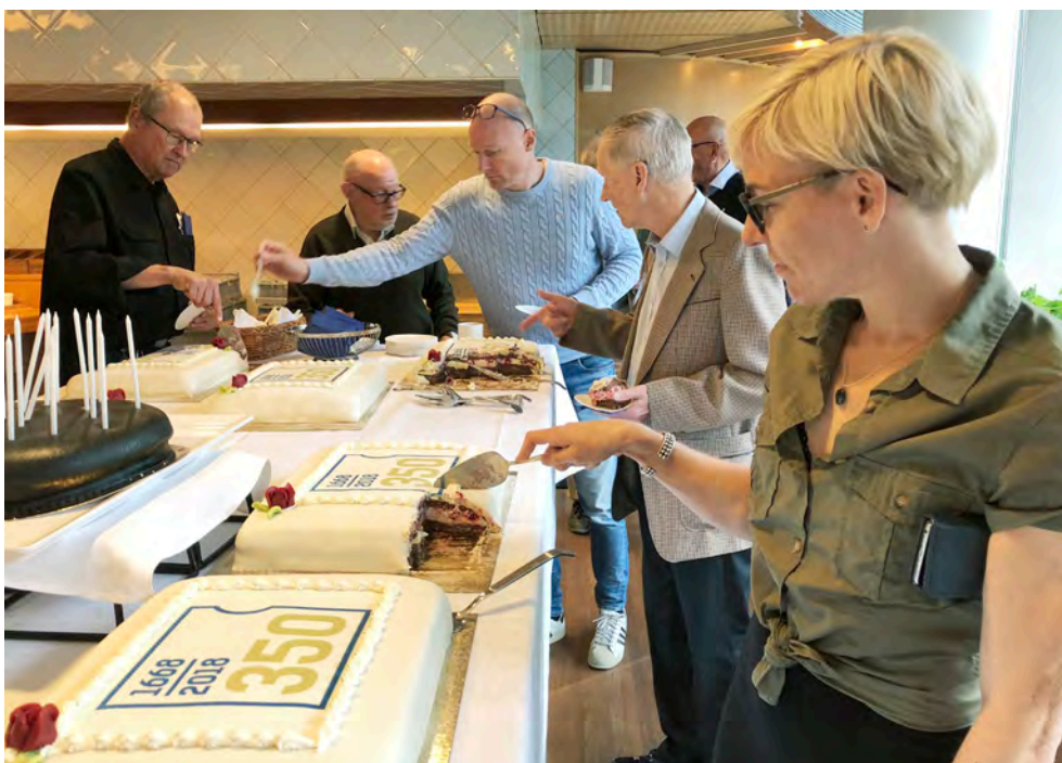
Tärtkalas för personalen och riksbankspensionärer den 21 september.

Alla riksbanksmedarbetare som önskade fick ett exemplar av jubileumsboken "Sveriges Riksbank and the History of Central Banking" som lanserades i samband med jubileumsdagen, vid en intern presentation den 24 maj.