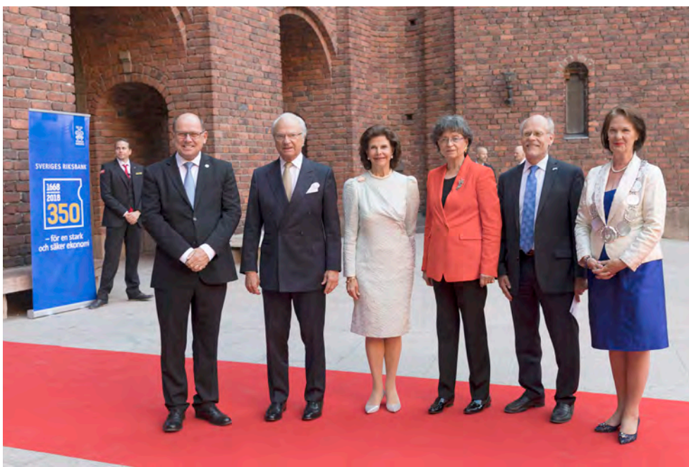
Kvällens värddar tillsammans med Kungäppelns ordförande och kommunfullmäktiges ordförande.

Den höga säkerheten krävde att alla gäster registrerades vid ankomst till middagen. Inpasseringen och registreringen när gästerna anlände till Blå hallen fungerade som helhet smidigt. Leverantören av blippsystemet hade också tillverkat entrékorten med blippkoderna. Dessa personliga entrékort hade delats ut tidigare under dagen, vid konferensen. De som inte deltog i konferensen hade fått entrékorten på annat sätt. De personliga entrékorten gjorde att gästerna enkelt kunde blippas in. Däremot uppstod förvirring om huruvida VIP-gäster med personskydd och övriga centralbankschefer skulle blippas eller inte och vilken dörr de skulle använda. Detta reddes egentligen aldrig ut och funktionärerna blev därmed osäkra på om de gjorde rätt när de bad centralbankschefer visa sina entrékort. En viktig lärdom att ta med sig är att tydliggöra vem som är ytterst ansvarig vid inpasseringen och säkerställa att alla funktionärer känner till detta.