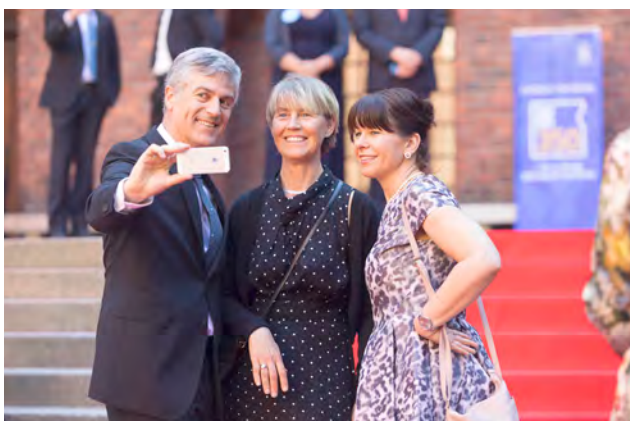
Gäster anländer till jubileumsmiddagen.