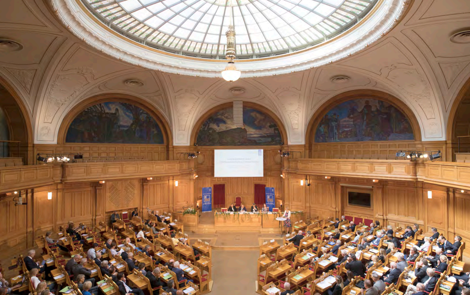
Andrakammarsalen i riksdagen där jubileumskonferensen hölls.