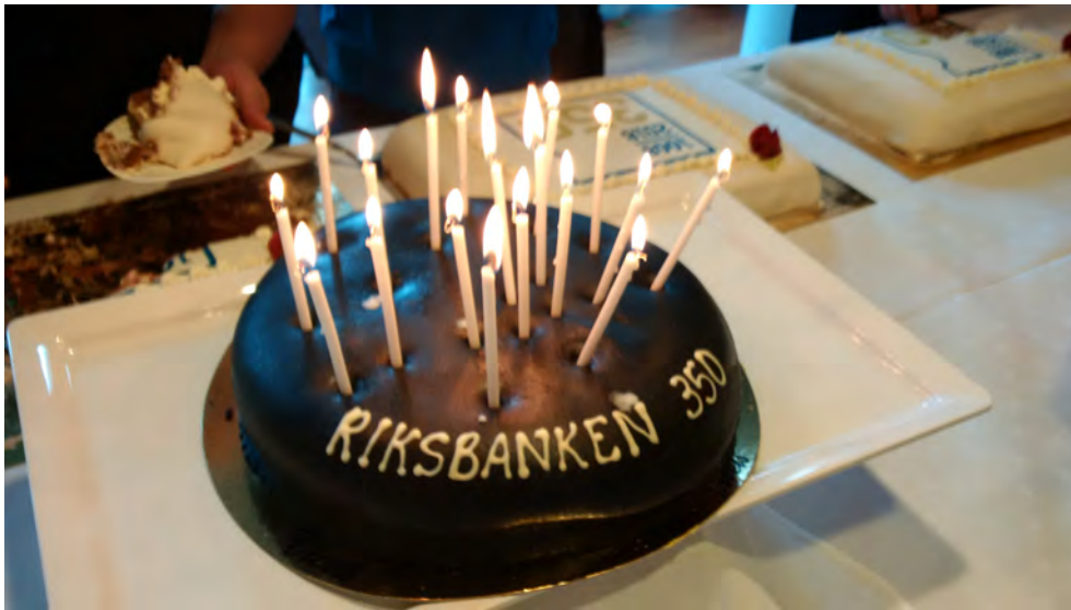
Tårtkalas för personalen och riksbankspensionärer den 21 september.

Riksbankens personal erbjöds vidare att under hösten besöka Tumba bruksmuseums utställning om Riksbankens 350 år. Detta besök arrangerades av Riksbankens kulturförening.