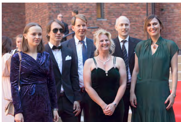
Gäster anländer till jubileumsmiddagen.