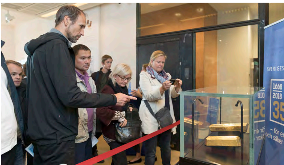
Guldmontern var populär.

Utöver det återanvände vi bordet med beskrivning av våra säkerhetsdetaljer på sedlarna, som vi tidigare visat vid sedel- och myntlanseringen. Dessutom hyrde vi in en digital skärm där man kunde söka på tidslinjen som tagits fram till vår webbplats.