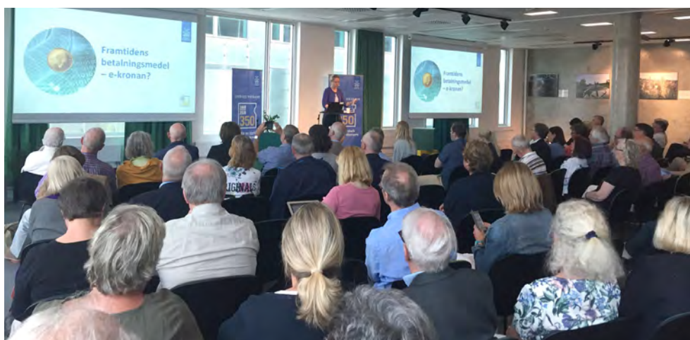
Jubileumsturné i Malmö.

För att uppmärksamma 350-årsjubileet i hela landet anordnade Riksbanken evenemang för allmänheten på sex av de orter i landet där Riksbanken har haft lokalkontor. Det skedde i form av en jubileumsupplaga av direktionens penningpolitiska turnéer som genomförs varje år över hela landet.