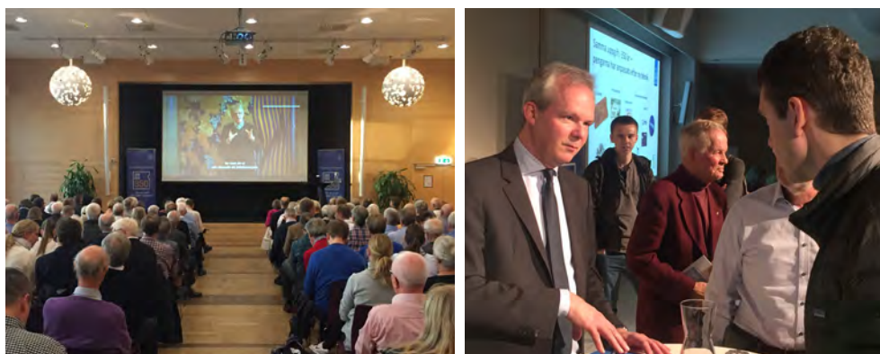
Jubileumsturné i Göteborg (vänster bild) och i Linköping (höger bild).

Jubileumsturnéerna bestod av de vanliga föredragen och studiebesöken som är en del av de penningpolitiska turnéerna, men under 2018 kopplade vi på ett evenemang som riktade sig till allmänheten på orten. Evenemanget för allmänheten var en föreläsning av en direktionsledamot på temat "Från kopparmynt till e-krona" och till det bjöds på kaffe och 350-årstårta.